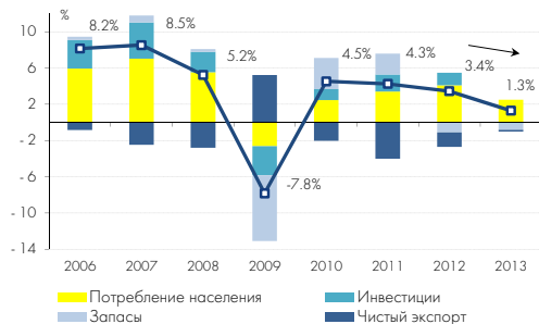
Вклад ключевых компонент в Структура ВВП по производству, формирование ВВП, 2006-2013 гг. вклад компонент в п.п., 2012-2013 гг.